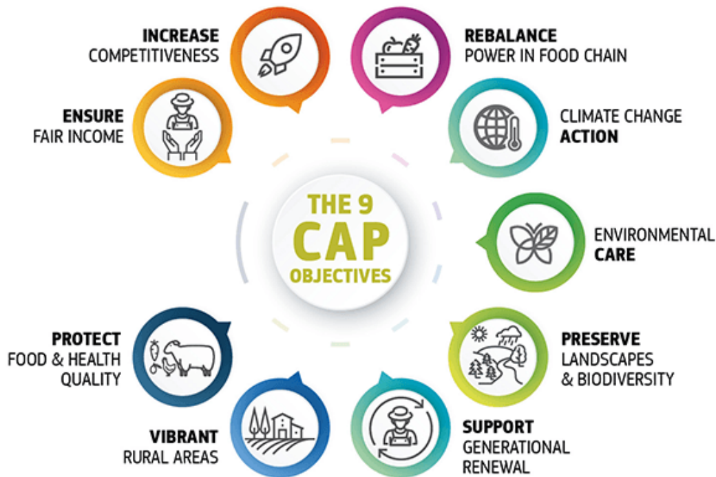
Slika 3. ZPP posebni ciljevi za 2021-27