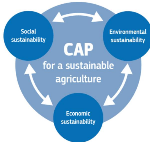
Slika2. Tri elementa održive poljoprivrede